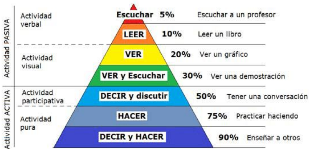
Piramide del Aprendizaje